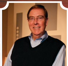
게리 체프먼 사랑의 5가지 언어