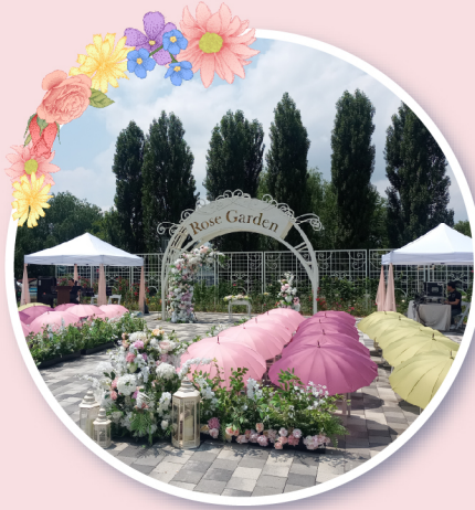
한강공원 광나루 장미원