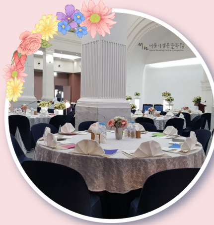
시민청 (태평홀, 동그라미방)