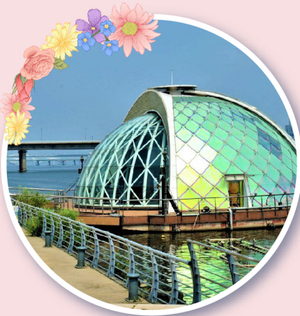
한강공원 물빛무대 (동)