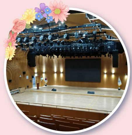
서울시청 본관8층 다목적홀