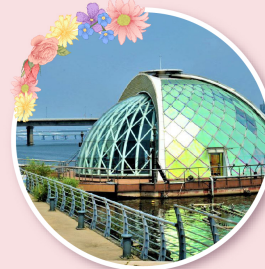
한강공원 물빛무대 (동)