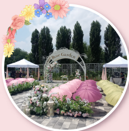
한강공원 광나루 장미원